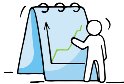
Op maat gemaakte en vertrouwelijke sessies voor elk bedrijf