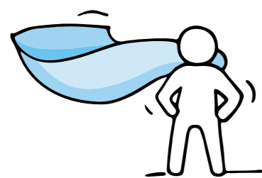
De beste experts op het gebied van uitdagingen voor familiebedrijven

aandeelhouders en/of familieleden een compleet beeld krijgen van de voordelen en effecten van de verschillende financieringsmogelijkheden die er op de kapitaalmarkt beschikbaar zijn, of het nu gaat om aandelenkapitaal of vreemd vermogen financiering in combinatie met de voor u belangrijke onderwerpen.